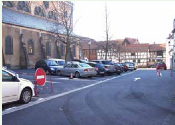
Les travaux du parking Place Friedel se sont terminés fin novembre