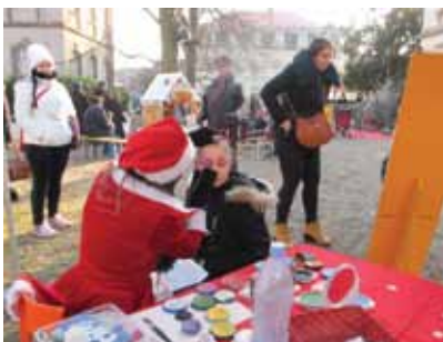
Des animations pour les enfants : contes, maquillage et lâché de ballons au marché de Noël