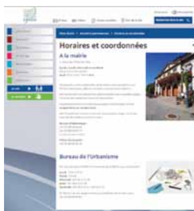
Page intérieure du nouveau site