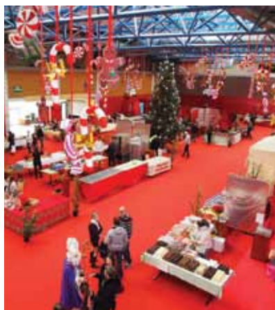
Le marché aux sucreries à la salle Herinstein