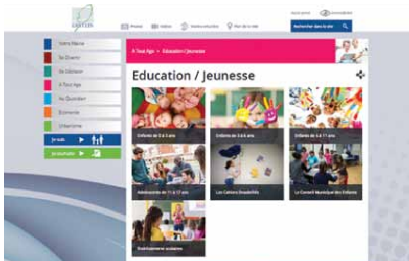
Menu Education/Jeunesse de la rubrique A tout âge

N'hésitez pas à réagir et à donner votre avis par mail à participation.citoyenne@ville-erstein.fr