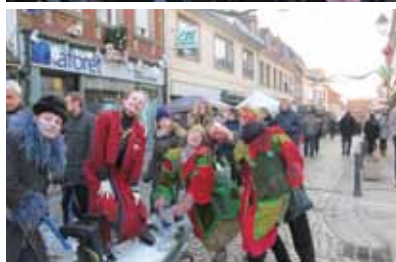
Déambulations du théâtre d'Ochisor