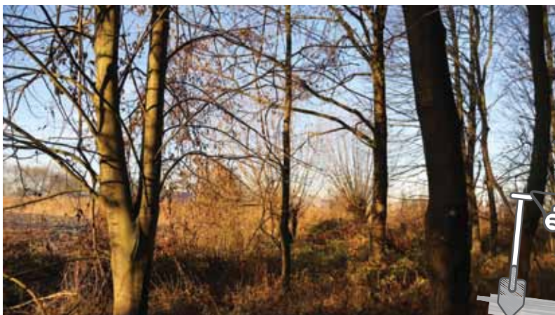
Premier chantier d'entretien de l'arboretum par l'Association Nature Ried d'Erstein

Un premier chantier d'entretien a eu lieu le 10 décembre en attendant le projet de mise en valeur de l'arboretum par l'ANRE.