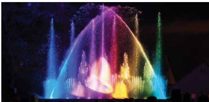
Spectacle La féerie de l'eau place des Fêtes