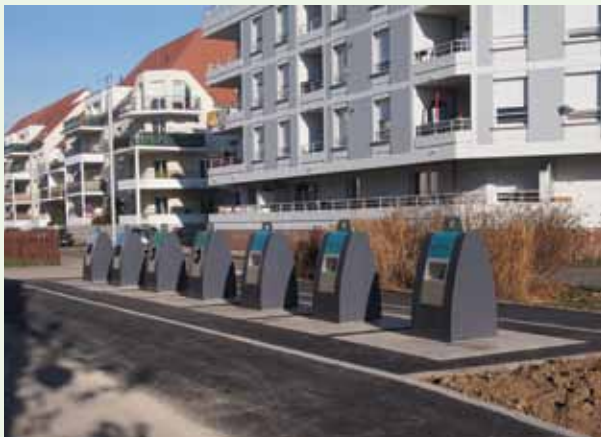
Les points d'apport volontaire rue Laine Peignée ont été enterrés