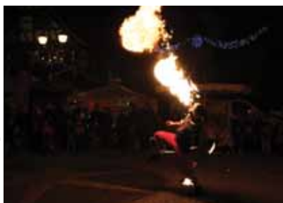
Le cracheur de feu a réchauffé l'atmosphère