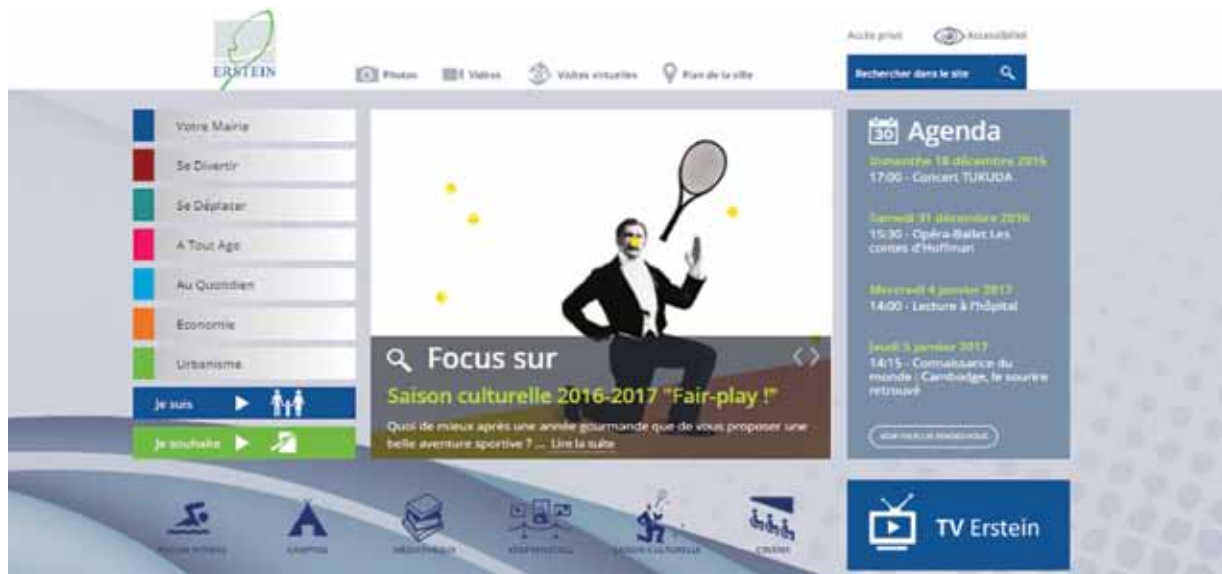
Page d'accueil du nouveau site