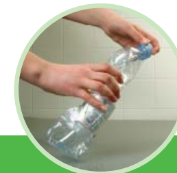
Rebouchez-la. Vous pouvez la déposer dans un conteneur bleu.