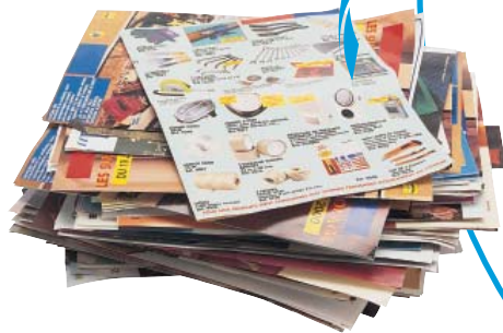
Journaux, magazines et prospectus