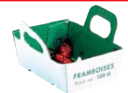
Emballages sales et non vidés

Non recyclé > À jeter dans votre poubelle habituelle