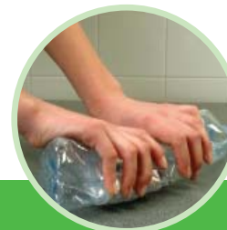
Écrasez votre bouteille (débouchée) à plat.

Oui : vous réduirez ainsi leur volume et faciliterez leur collecte et leur recyclage. Mais, attention : écrasez-les à plat (sur une table, par exemple) et rebouchez-les pour qu'elles ne se regonflent pas.