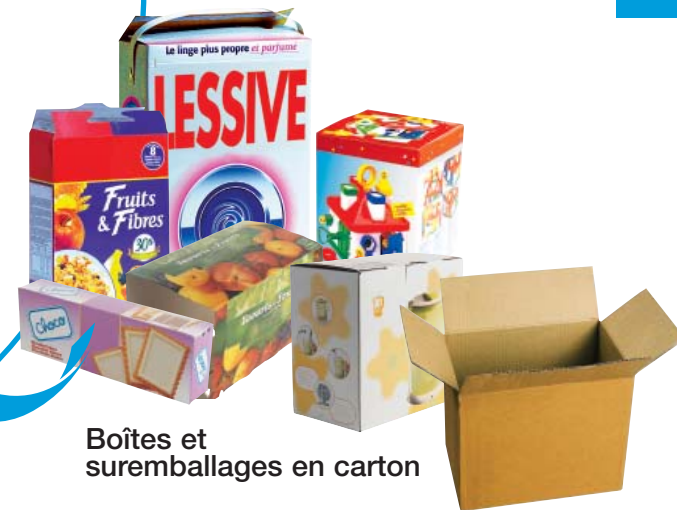
Boîtes et suremballages en carton