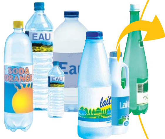
Bouteilles d'eau, de jus de fruit, de soda, de lait,