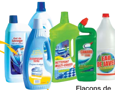
Flacons de produits ménagers