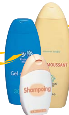
Flacons de produits d'hygiène